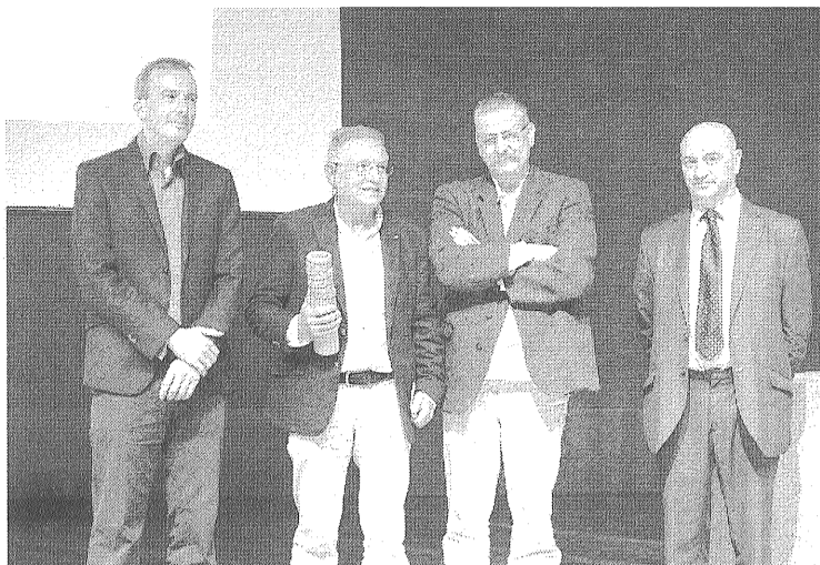
Momento del acto celebrado el pasado 14 de noviembre en Las Palmas.

Reside durante dos meses en La Habana (Cuba). Allí se dedica a la formación en el Instituto Superior de Arte.